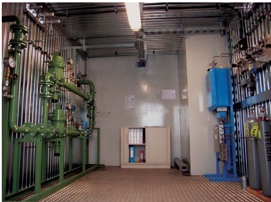
Bild 2: Mengen- und Gasbeschaffenheitsmessung für Biogas nach G260

Soll die Sauerstoffmessung dagegen mit einem Gaschromatographen erfolgen, erfordert dies einen erheblichen Mehraufwand: Um die chromatographische Trennung von Sauerstoff und Stickstoff zu ermöglichen müssen zusätzlich so genannte Molsieb-Säulen eingesetzt werden. Diese Molsiebe müssen vor Kohlendioxid und Feuchtigkeit geschützt werden, da sonst die Trennleistung für Sauerstoff und Stickstoff beeinträchtigt wird. Deshalb muss das Trägergas aufwendig mittels geeigneter Absorber nachgereinigt werden. Diese Absorber